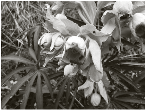
Ellébore fétide, Hautes Alpes, fév. 2010.

« tu ne sais pas que la salive de l'homme c'est un contre-poison de la morsure de vipère ? » Et oui. Et il paraît que s'il y avait des vipères ou des couleuvres et que vous leur donniez du lait dans lequel vous aviez craché, en le buvant, elles ingéraient aussi la salive de l'homme et en mourraient », m'a confié le même paysan de Bouchanière. L'association lait-salive humaine dite mortelle pour le serpent, est une croyance plusieurs fois évoquée dans le Mercantour, certains anciens parlant de soucoupes disposées à l'entrée des bergeries, d'autres encore de ce mélange appliqué sur les murs des granges : « On mettait du lait dans une tasse et on crachait dedans, m'explique-t-on à Isola. Donc le crachat de l'être humain, c'était un venin pour la vipère. Et ça marchait à tous les coups, ça faisait mourir les serpents. Il arrivait que l'on voit une vipère et que l'on n'arrive pas à la tuer. Alors on crachait dans une tasse où l'on mettait du lait de vache, et les serpents, les vipères, étaient gourmandes de lait, elles le sentaient d'assez loin ; elles venaient boire ce lait, et puis on les retrouvait mortes ». Il est fort probable que les représentations qui associent le lait et le serpent soient répan-